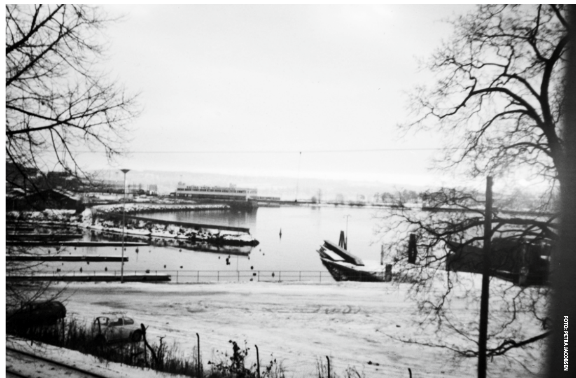
Utsikt fra leiligheten i Skappels gate 2. Mjøsa finner vi igjen i flere av Rolf Jacobsens dikt, f.eks. som «innlandshavet med det store lyset» i diktet «Tanker ved Ånestadkrysset».